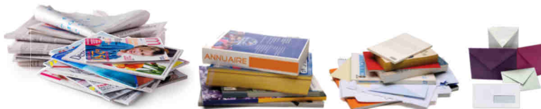
Tous les papiers se trient et se recyclent : journaux, magazines, publicités, livres, cahiers, annuaires, catalogues, enveloppes.