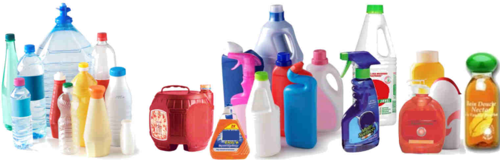
Bouteilles, flacons en plastique (alimentaire, entretien & hygiène)