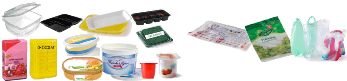
Barquettes, boîtes et pots en plastique et en polystyrène