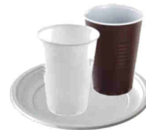
Gobelets et assiettes jetables